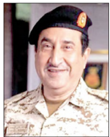
الشيخ خالد بن علي آل خليفة

الفحائات أثبتت نجاحها في مواجهة فيروسات أخرى. ولفت الشيخ خالد بن علي إلى جاهزية الطاقم الطبي، ومتابعة د. جليلية السيد استشرارية الأراض المعديّة بجمع السلّمانيّة الطبيّة المباشرة للعمل في مركز المعارض، وقال إنّ العملية برمتها لا تتعدى 45 دقيقة، ولا أعراض جانبية تذكر غير احمرار في منطقة الإبرة، مبيّناً أنه في إيجاد لقاح آمن يستفيد منه العالم بأكمله، كما أشاد بالتنظيم الكبير والإجراءات الأمانة عند أخذ التطعيم، ووجود متابعات مستمرة إلى حين أخذ الجرعة الثانية بعد 21 يوماً، أملاً سرعة عودة الحياة لطبيعتها.