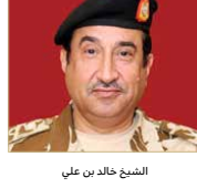
الشيخ خالد بن علي

في تصريح لوكالة الأنباء البحرين ببلوغ العدد المطلوب وهو 6 آلاف متطوع، وبين أن الفيروس المستخدم في اللقاح فيروس معطل وهي طريقة كلاسيكية متبعة في عالم اللقاحات أثبتت نجاحها في مواجهة فيروسات أخرى. وقال إن العملية بومتها لا تتعدى 45 دقيقة، ولا أعراض جانبية تذكر غير احمرار في منطقة الإبرة، أما إيجاد لقاح من يستفيد منه العالم بأسره، كما أشار بالتنظيم الكبير والإجراءات الأمتة عند أخذ التطعيم، ووجود مناهبات مستمرة إلى حين أخذ الجرعة الثانية بعد 21 يوماً، أما سرعة عودة الحياة لطبيعتها.