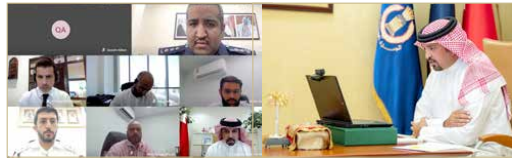
رئيس الجمارك يبحث مع الرؤساء التنفيذيين لشركات النقل السريع السبل الكفيلة بتسريع الإجراءات الجمركية

♦ أحمد بن حمد: توضيح أسباب التأخير بكل مصادقية للارتقاء بجودة العمل