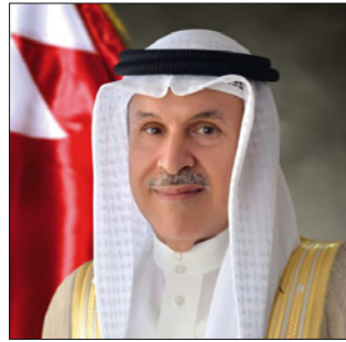
الشيخ هشام بن عبدالرحمن آل خليفة

وأشار إلى أن محافظة العاصمة بالتعاون والتنسيق مع الجهات المعنية قامت باتخاذ عدد من الإجراءات بغرض تخفيف الكثافة في المباني المرصودة وتعديل المخالفات فيها، والتي تمثلت في تكديس أعداد كبيرة من العمال في غرف تفترق إلى أدنى اشتراطات الأمن والسلامة، إضافة إلى أن التوصيلات الكهربائية غير آمنة، إذ تواصلت مع الشركات التي يقطن عاملاتها وسط المنامة، وذلك لإيجاد سكن بديل لهم في مناطق أخرى بغرض تخفيف الكثافة في المباني التي يسكنونها، موضحاً أنه تم ملاحظة وجود تكدس داخل عدد من الشقق في بعض المباني رغم وجود شقق أخرى خالية بالمبنى، مؤكداً أن المحافظة عملت على التنسيق مع ملاك المباني على توزيع العمال على تلك الشقق بغرض تخفيف الكثافة الموجودة.