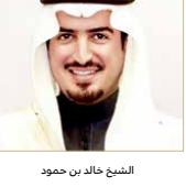
الشيخ خالد بن حمود

تعميم التجربة لتشمل الوحدات في المرحلة الثانية