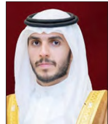
الشيخ محمد بن راشد

أشاد الشيخ محمد بن راشد بن خليفة آل خليفة وكيل ديوان صاحب السمو الملكي الأمير خليفة بن سلمان آل خليفة رئيس مجلس الوزراء الموقر، رئيس أمانة جائزة خليفة بن سلمان آل خليفة للطبيب البحريني، بتفاعل المؤسسات الطبية بمملكة البحرين والأطباء البحرينيين، والتي تقدّم بنسختها الأولى تزامناً مع إحتفاء المملكة بيوم الطبيب البحريني في نوفمبر المقبل. وصرح «إن مملكة البحرين بقيادة سيدي حضرة صاحب الجلالة الملك حمد بن عيسى آل خليفة عاهل البلاد المفدى بحفظه الله ورعا، ماضية في نهجها