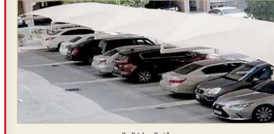
موقف السيارة الحالي

مكتسب للمنتفع لا يمكن انتزاعه مرة أخرى، فعليه وبما أن العمارة المذكورة اكتملت فلا يوجد لدى الوزارة موقف فارغ يمكن تخصيصه للمواطن. وقال إنه وبناء على خطاب الوزارة بعدم وجود موقف فارغ طالب أمانة العاصمة بتخصيص أحد المواقف العامة القريبة من المبنى والتابعة لوزارة الإسكان