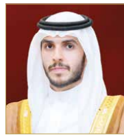
الشيخ محمد بن راشد

أشاد وكيل ديوان صاحب السمو الملكي رئيس مجلس الوزراء، رئيس أمانة جائزة خليفة بن سلمان آل خليفة للطبيب البحريني الشيخ محمد بن راشد بن خليفة آل خليفة بتفاعل المؤسسات الطبية بمملكة البحرين والأطباء البحرينيين، التي تقدم بنسختها الأولى تزامناً مع احتفاء المملكة بيوم الطبيب البحريني في نوفمبر المقبل.